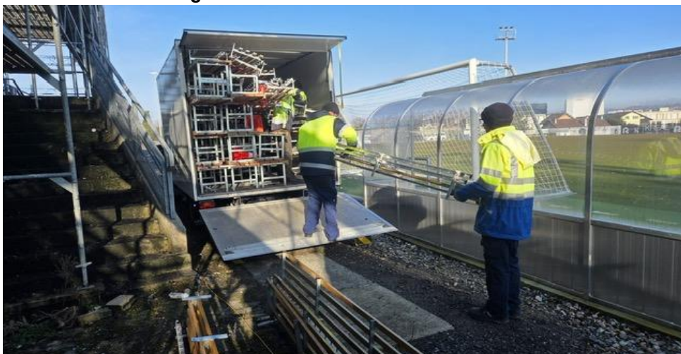
Chantier de démontage de bancs et d'assises d'un terrain de football