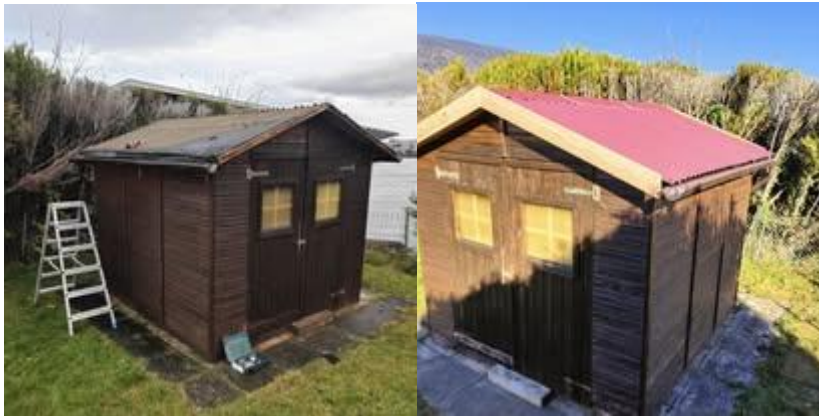
Réfection d'un toit de cabane de jardin