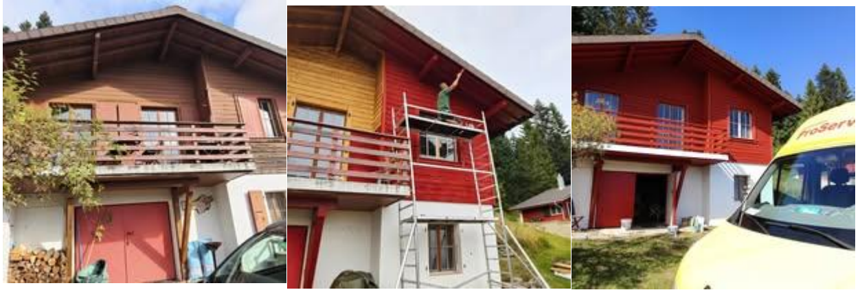
Ci-dessus : rénovation complète (sablage, peinture) d'un chalet