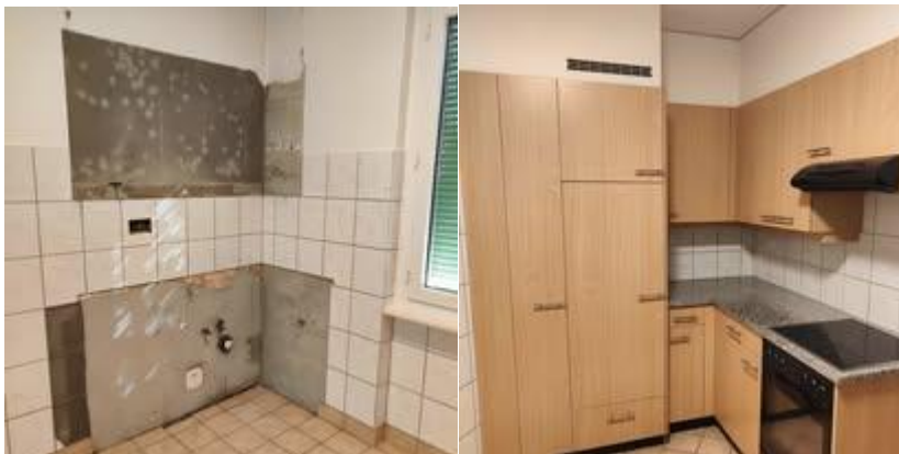
Installation d'une cuisine de 2 e main vendue par Pro Travail