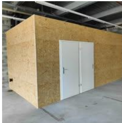
Fabrication et montage de parois pour une industrie

Et quelques exemples divers de nos interventions :