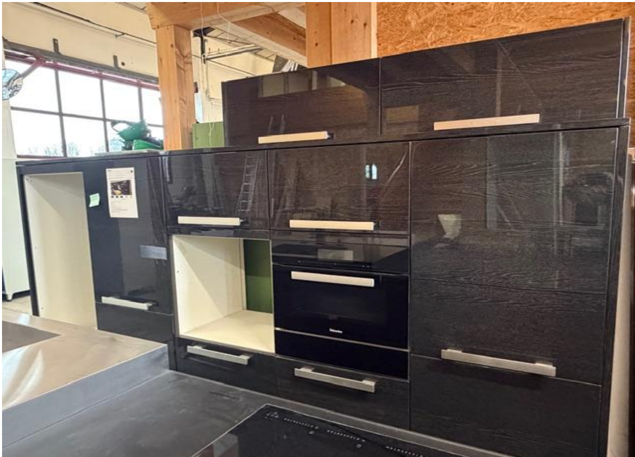
Divers appareils ménagers d'occasion sont exposés à la vente (frigos, congélateurs, cuisinières, fours)