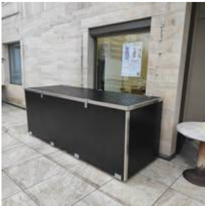
Fabrication d'une caisse de rangement pour mobilier en extérieur.