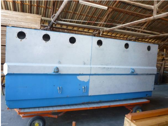
Benne en cours de décapage