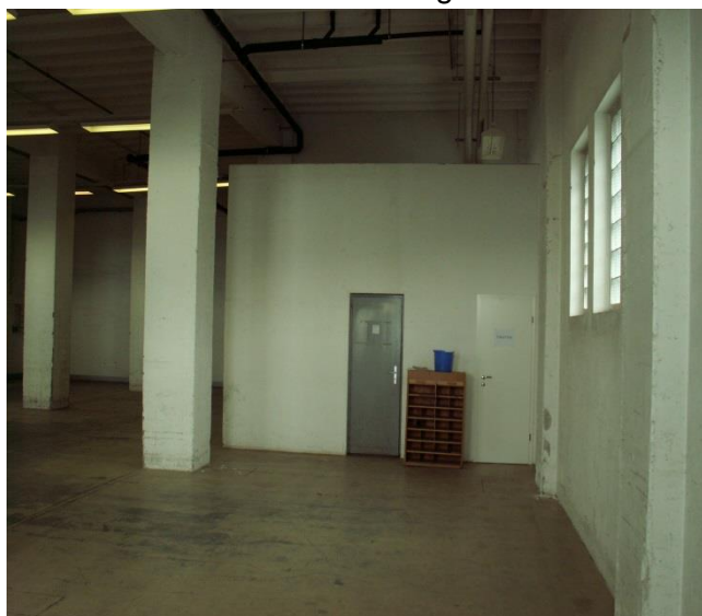
Halle avant transformation magasin